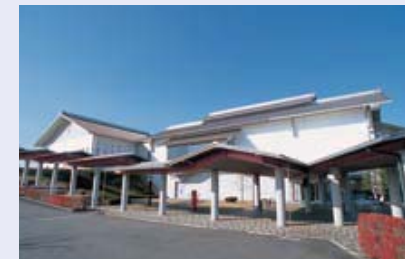
奥州市牛の博物館

肉質日本一を誇る「前沢牛」を格安で食べられるお祭り。毎年、有名な歌手を招いて、コンサートを開催し、牛の鳴きまねコンテスト等の無料イベントを行うなど、各地からやってくる、肉好きのお客様で賑わいます。